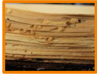
Viespi de lemn