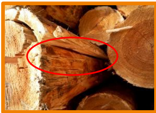
Crăpătură pe suprafața laterală

Sunt relevante crăpăturile frontale, cele de inimă și cele de pe suprafața laterală. Buștenii care prezintă doar crăpături superficiale frontale și de inimă nu sunt declasați, în timp ce buștenii care prezintă crăpături profunde frontale, de inimă și pe suprafața laterală sunt declasați.