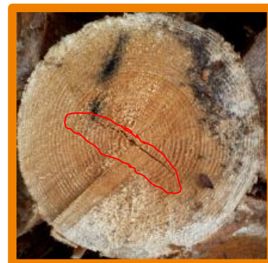
Crăpătură frontală superficială de inimă