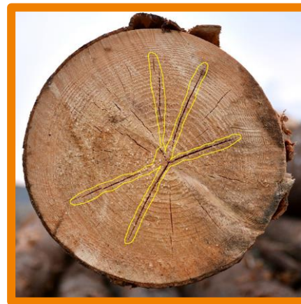
seichter Stirn- und Kernriss