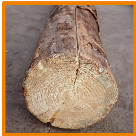
Risse entlang der Mantelfläche

Relevant sind hier der Stirn- bzw. Kernriss und Risse entlang der Mantelfläche. Während bei seichten Stirn- bzw. Kernrissen keine Abstufung erfolgt werden Stämme mit tiefen Stirn- bzw. Kernrissen und Rissen entlang der Mantelfläche abgewertet.