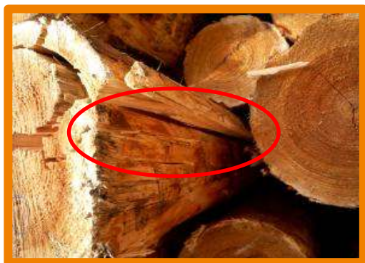
Crăpătură pe suprafața laterală

Sunt relevante crăpăturile frontale, cele de inimă și cele de pe suprafața laterală. Buștenii care prezintă doar crăpături superficiale frontale și de inimă nu sunt declasați, în timp ce buștenii care prezintă crăpături profunde frontale, de inimă și pe suprafața laterală sunt declasați.