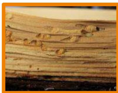
Viespi de lemn