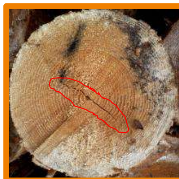
Crăpătură frontală superficială de inimă