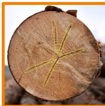
Crăpătură frontală superficială de inimă