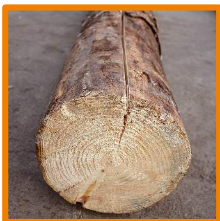
Crăpătură pe suprafața laterală

Sunt relevante crăpăturile frontale, cele de inimă și cele de pe suprafața laterală. Buștenii care prezintă doar crăpături superficiale frontale și de inimă nu sunt declasați, în timp ce buștenii care prezintă crăpături profunde frontale, de inimă și pe suprafața laterală sunt declasați.