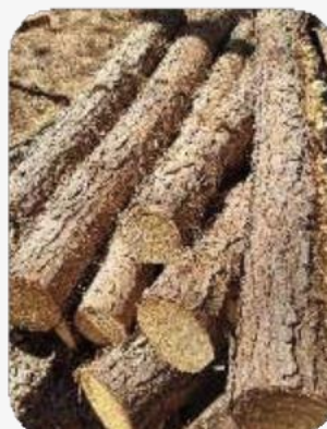
Buen desrame Correcto

En el anexo se detallan las calidades de desrame permitidas y cuáles no.