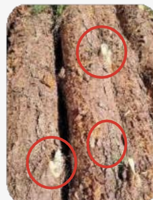
Mal desrame o incorrecto