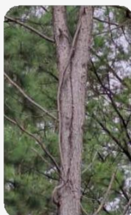
Árbol con horqueta

Los rollos deberán tener forma cilíndrica o con mínima conicidad. No se aceptarán árboles con horqueta, ramas con inserción tipo ángulos agudos (clavos) y/o corona de ramas.