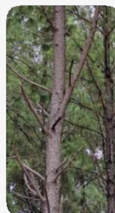
Árbol con rama en forma de clavo