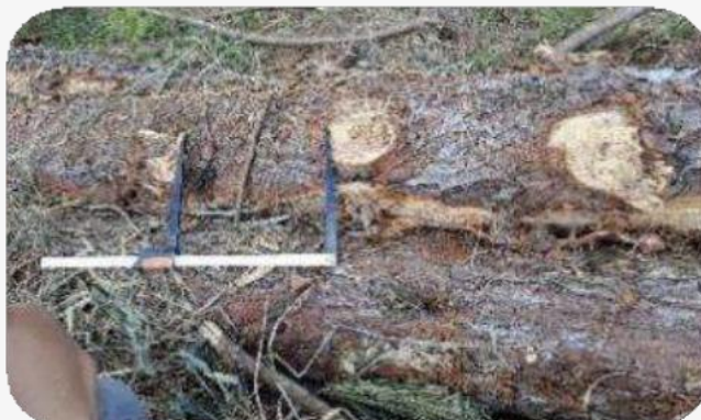
Rollos con muchos nudos y de gran tamaño no se aceptarán. En el Anexo se agregan más fotos.

Corona de verticilos: no se van a aceptar rollos que presenten este defecto y se considerará biomasa