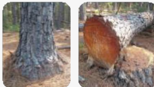
Ejemplo de Pata de Elefante

Esta sección impide el proceso en la línea de aserrado del rollo y por lo tanto no será aceptado.