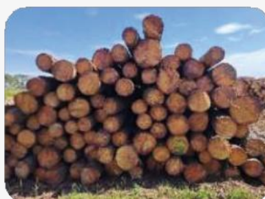
Se aceptarán cargas de rollos con diferentes diámetros

La asignación diamétrica y la calidad de cada rollo será definida en base a los resultados obtenidos en la línea de clasificación de rollos con corteza en planta, equipada con escáner 3D, rayos X y detector de metales. La facturación y precios se acordarán en el contrato.